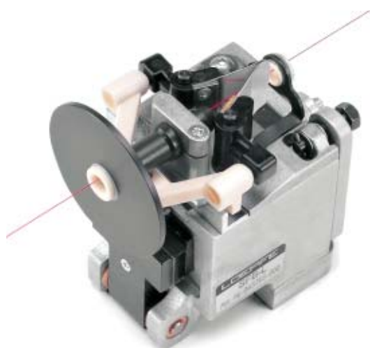
Freno de muelle de cromo corto