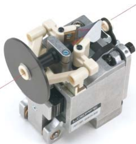
Freno a molla cromato lungo