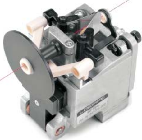
Freno a molla cromato corto